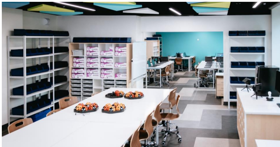
Универсальные и специализированные кабинеты, оснащенные удобной мебелью и современным оборудованием