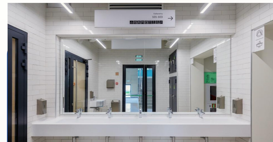
Умывальные обеденного зала