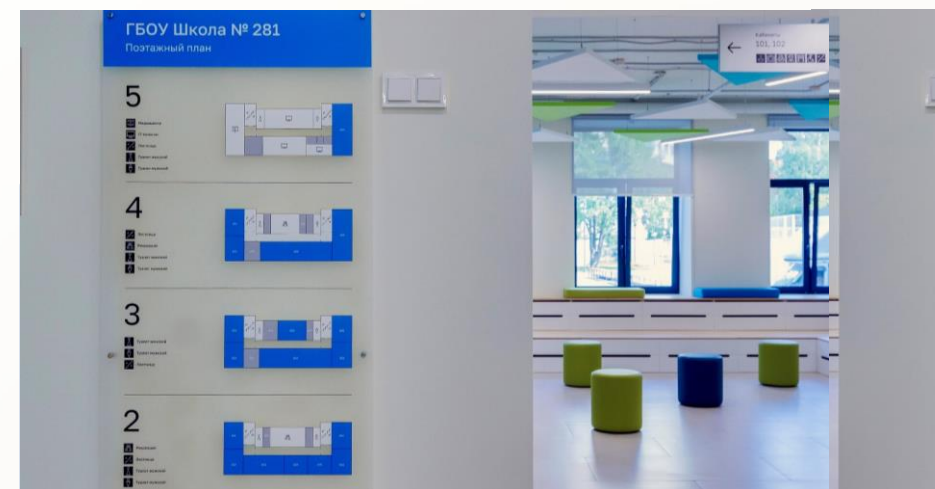
Единая графическая навигация